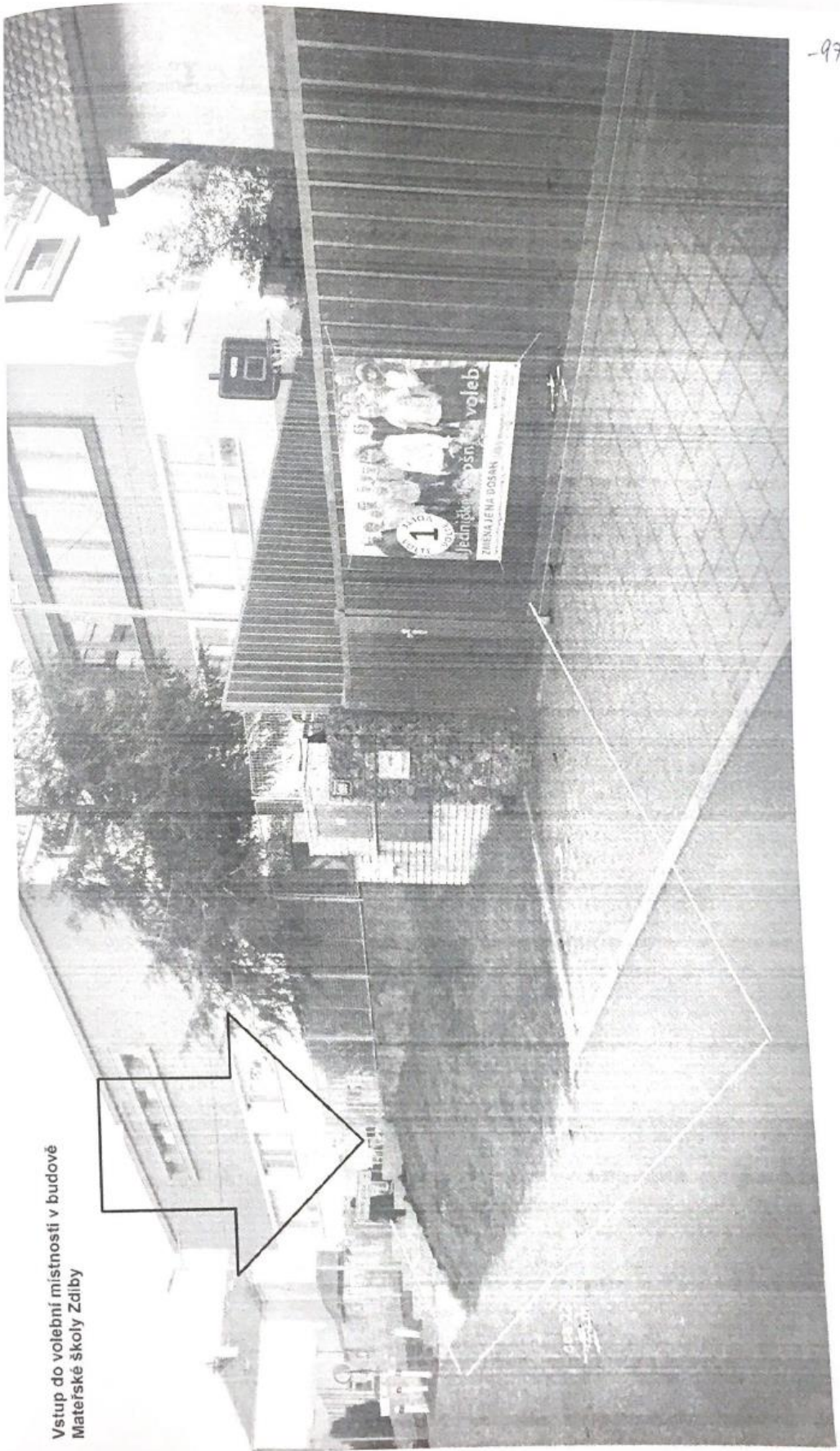
Vstup do volební místnosti v budově Materské školy Zdliby